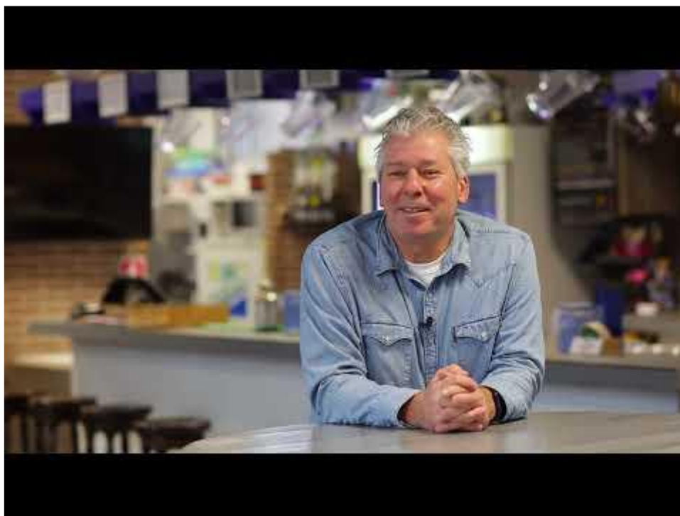
Verduurzaming bij Eminent Boys

MHC Fletiomare met de installatie van een warmtepomp, en voorbereidingen bij PVC en WDe Meern voor grootse maatregelen in 2026.