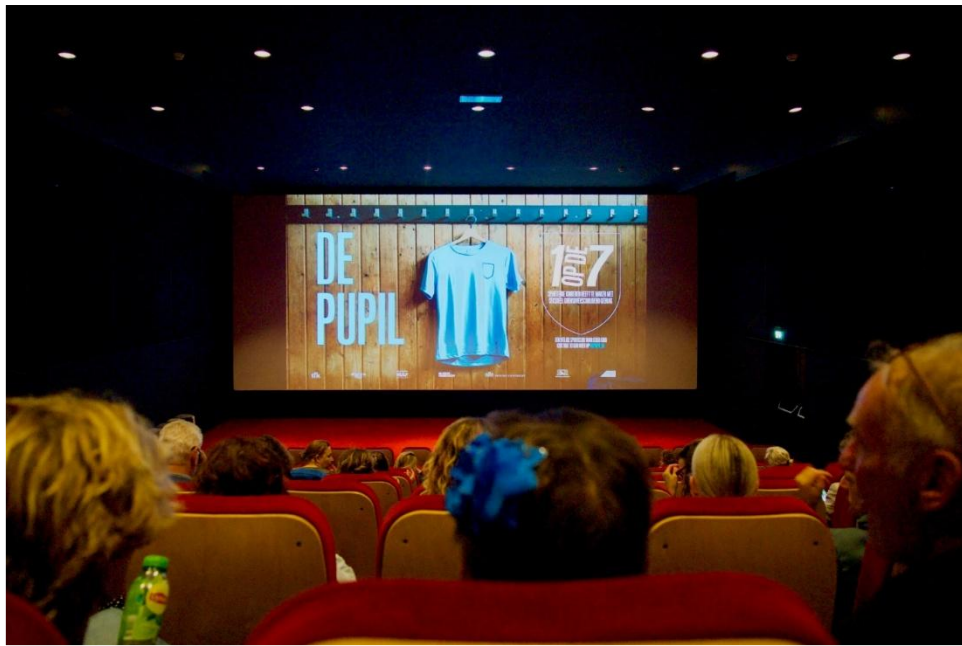
Filmvertoning De Pupil