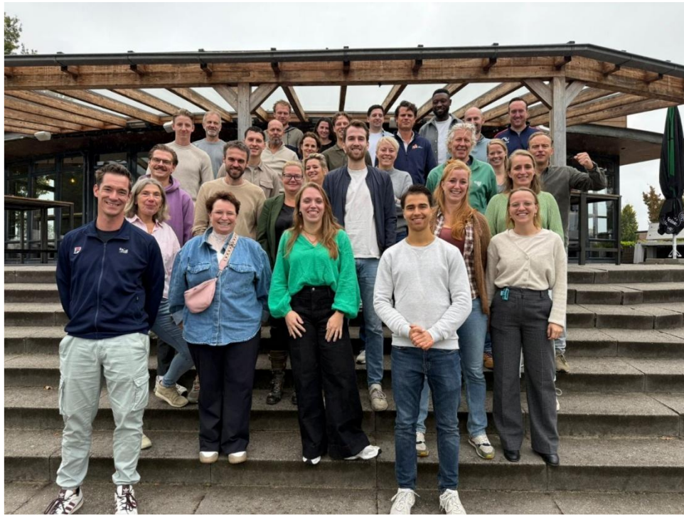
Regiobijeenkomst van het sport- en beweegloket