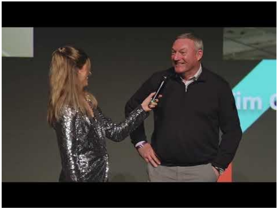
Aftermovie van de Utrechtse Sportprijs