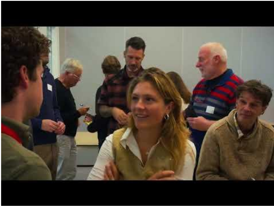
Aftermovie van de 030 Sport Meet-up