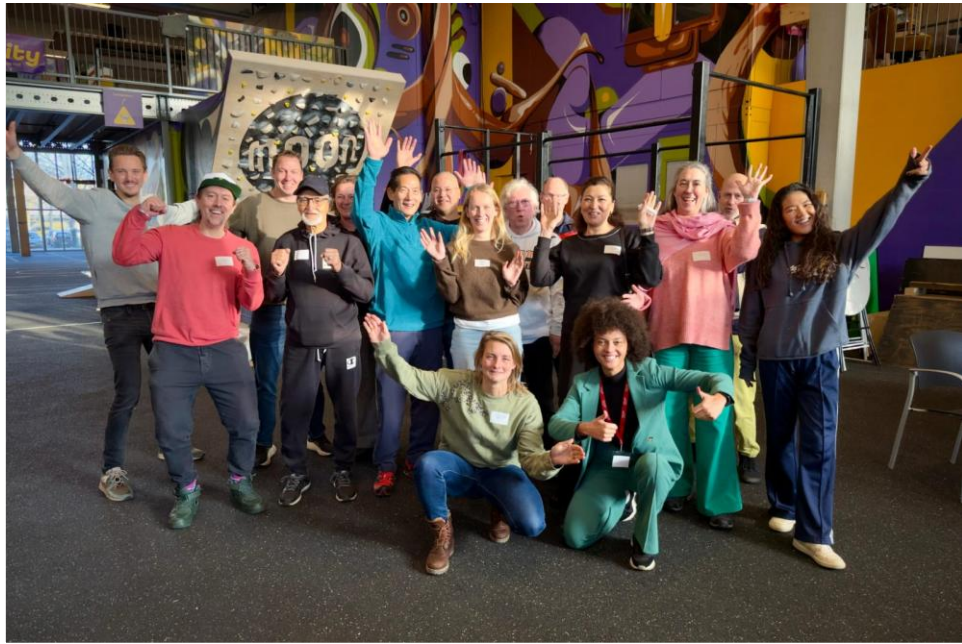
Netwerk van anders georganiseerde aanbieders in Noordwest en Overvecht