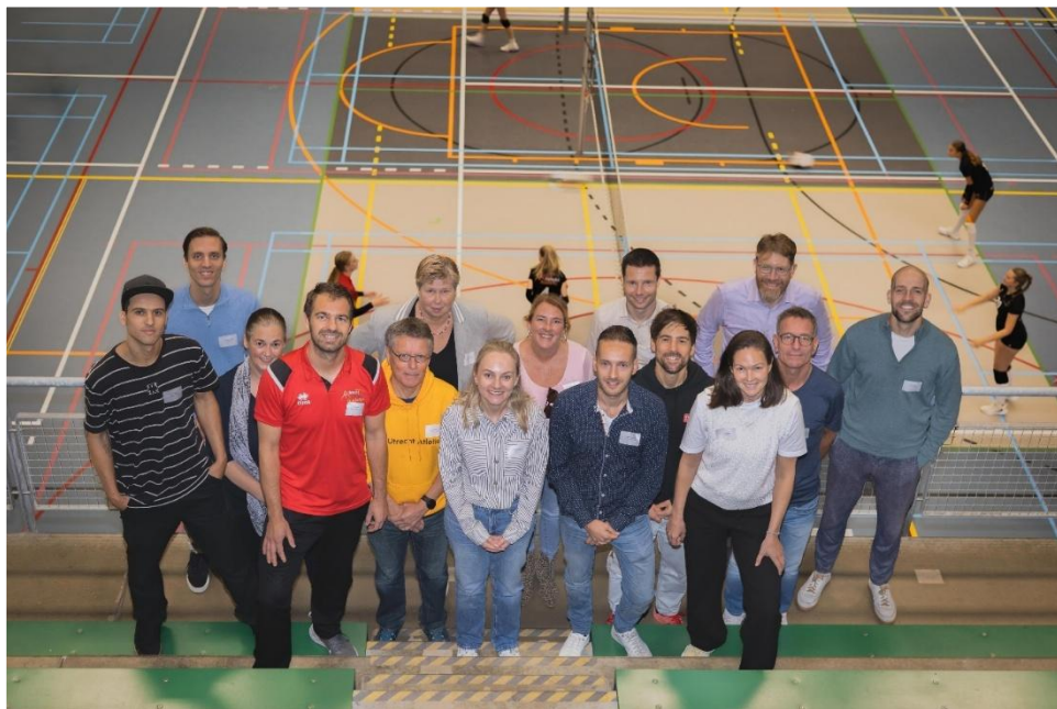
Aftrapmoment voor alle acht gesubsidieerde programma's

Het bereiken van dit doel maakt ons tevreden over onze aanpak. In 2026 zetten we deze voort, samen met sportclubadviseurs, door stadsbreed te bekijken welke andere (niet-gesubsidieerde) talentprogramma's ondersteuning kunnen gebruiken, zodat we een breed scala aan sporten kunnen blijven ondersteunen.