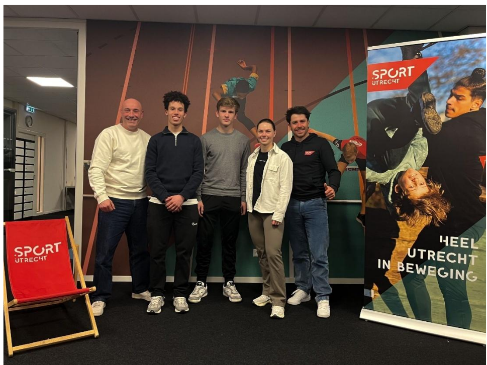
Ondersteuning van talentvolle sporters in samenwerking met SportsLink

Door langdurige uitval van de topsportlifestylecoach in het tweede tertaal ontbrak tijdelijk het vaste eerste aanspreekpunt, waardoor we minder sporters ondersteunden dan beoogd. Ook verkregen we daardoor in 2025 onvoldoende representatief inzicht in de tevredenheid van sporters en het bereik buiten bekende programma's. Feedback van sporters en ouders, zoals waardering voor voedingsadvies via de Sportkeuken en begeleiding in loopscholing bij RAF Training , laat zien dat ze de ondersteuning waardevol vinden. Deze aandachtspunten nemen we mee bij de doorontwikkeling van de aanpak in 2026.