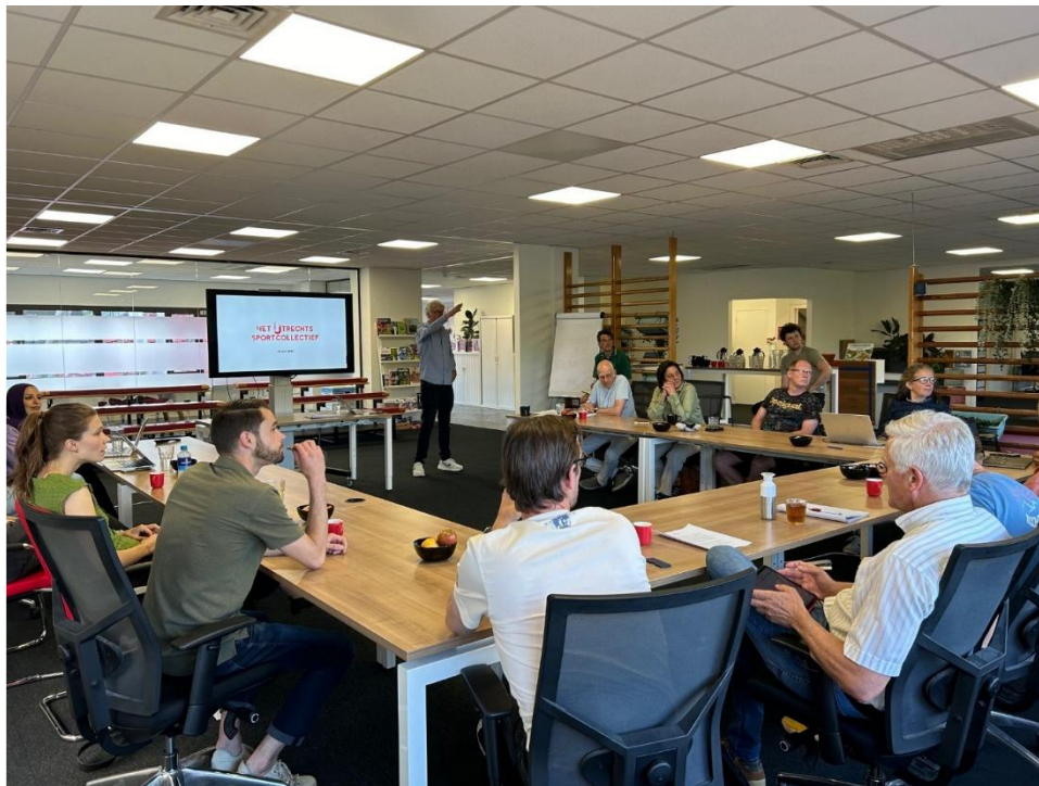
Bijeenkomst van het Utrechts Sportcollectief