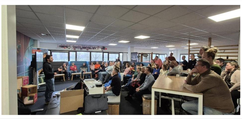
Ouderbijeenkomst voor ouders van talentvolle Utrechtse sporters

Dit doel markeert de eerste expliciete inzet op deze doelgroep. Over de twee bijeenkomsten verdeeld, bereikten we ruim honderd ouders, met telkens zeer positieve beoordelingen. Op basis van deze ervaringen zetten we deze aanpak in 2026 voort, met behoud van brede toegankelijkheid en een hogere streefwaarde.