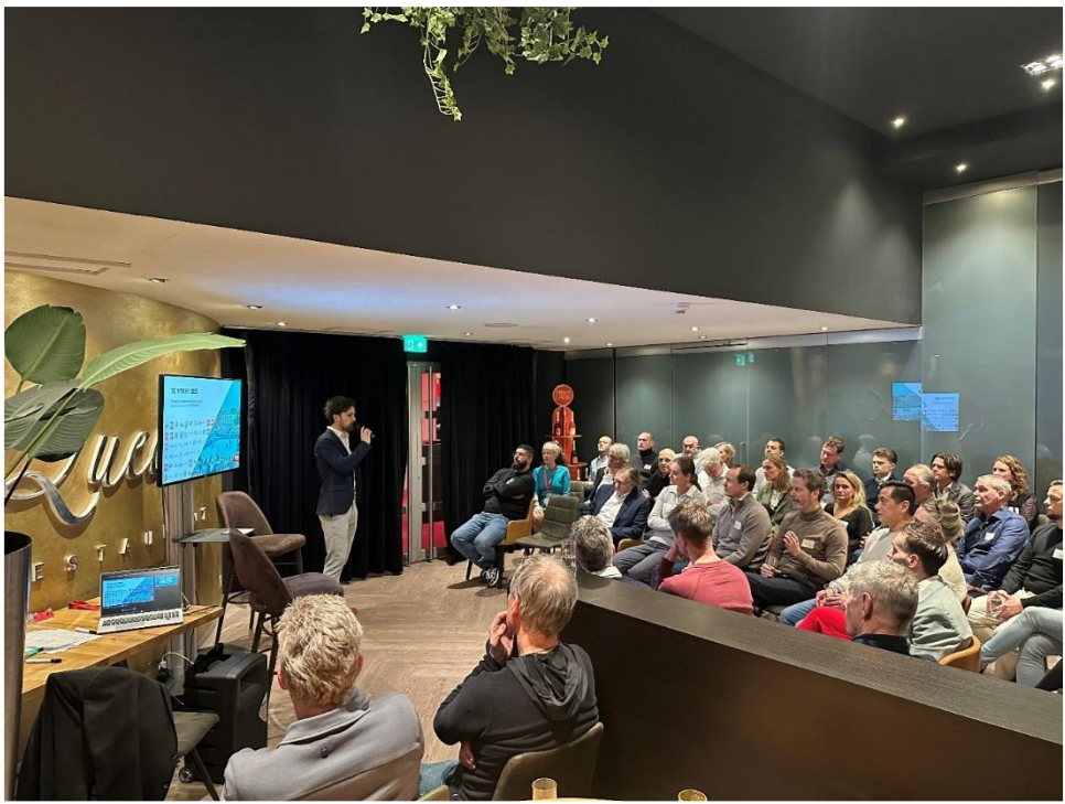
Eerste editie van het Utrecht Talent Center -netwerkdiner

“ In het laatste tertaal van 2025 organiseerden we nog een bijeenkomst voor onderwijsprofessionals, waarbij we topsportcoördinatoren uit mbo, hbo, vo en wo samenbrachten voor kennisdeling. Ook startten we de voorbereidingen voor de tweede editie van het Utrecht Talent Center -netwerkdiner op, dat plaatsvindt voorafgaand aan de Utrechtse Sportprijs in februari 2026. We nodigden ongeveer vijftig relevante partners uit, waaronder clubbestuurders, experts, gemeente, onderwijsprofessionals, sportaanbieders, (oud-)topsporters en trainer-coaches. In 2026 zetten we deze lijn voort, met focus op een sterke aftrap, samenwerking met Traiectum en het onderwijs én aanvullende meet-ups over specifieke kennisdeling met experts.